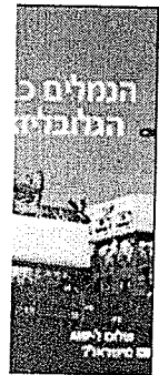
לחץ לקבלת ג

דף ראשי הפסקת מנוי שינוי פרטים יציאה מהמערכת צור קשר 04-6399558 מדיניות האתר הוסף למועדפים הפוך לאתר הבית